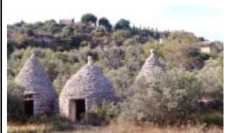
Ensemble de trois constructions de pierre sèche (bories)