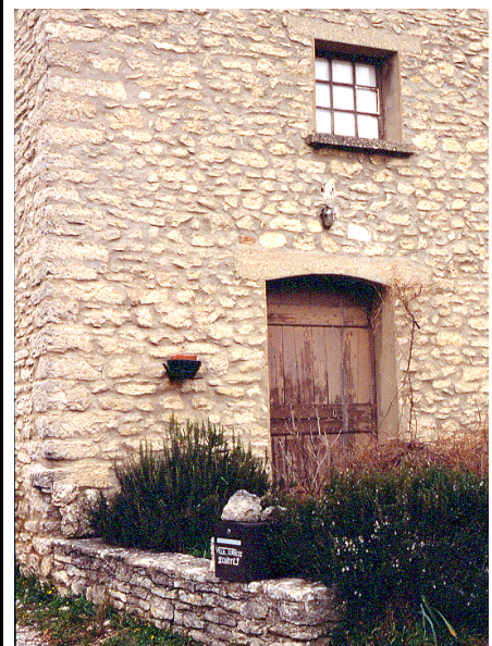
Façade mal décroûtée