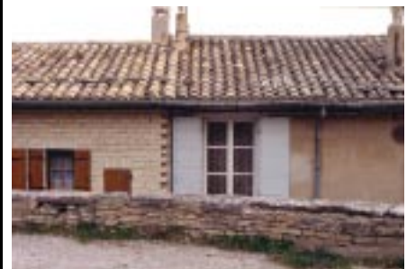
A gauche, maison à parement de pierre en doublage du mur